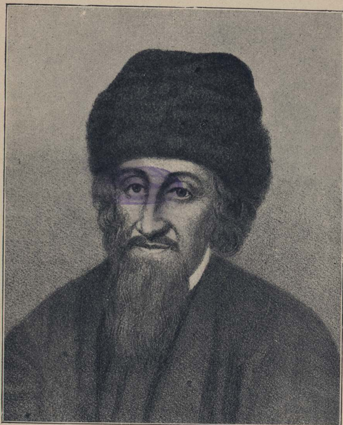
הנאון ר' צבי אשכנזי, "חכם צבי".